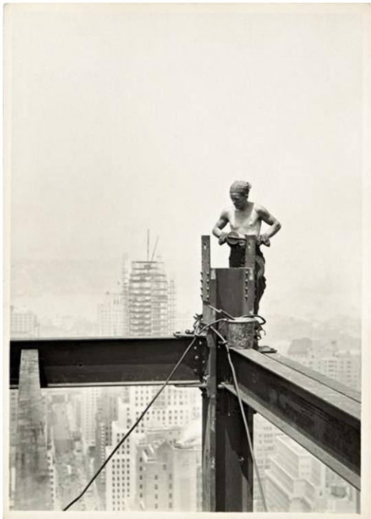
© Lewis Hine: On The Hoist, Empire State Building, 1931

A través de distintas confrontaciones visuales, esta exposición invita al espectador a experimentar el poder de la línea fotográfica a través de 120 fotografías.