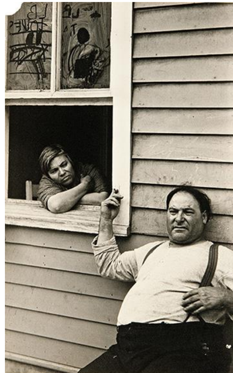
© Walker Evans- Ossining- People in Summer- NY State Town- 1931 © Walker Evans Archive- The Metropolitan Museum of Art